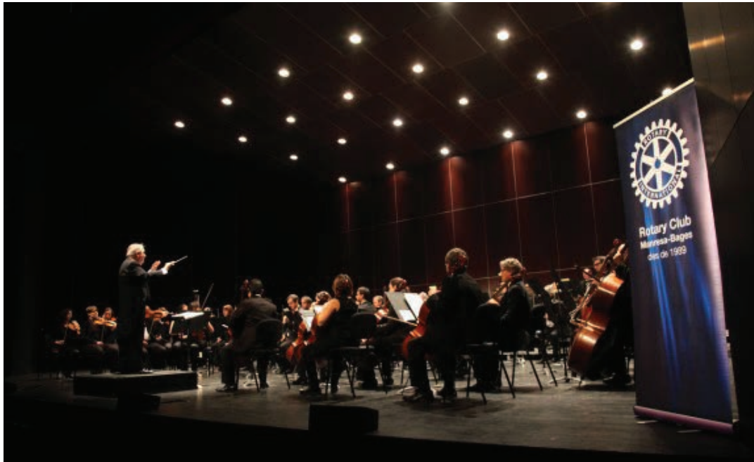
El Kursaal tornarà a acollir el Concert de Reis del Rotary.

Tindrà lloc diumenge a càrrec de l'Orquestra Simfònica Sant Cugat, que oferirà un concert amb peces típiques d'aquestes dates