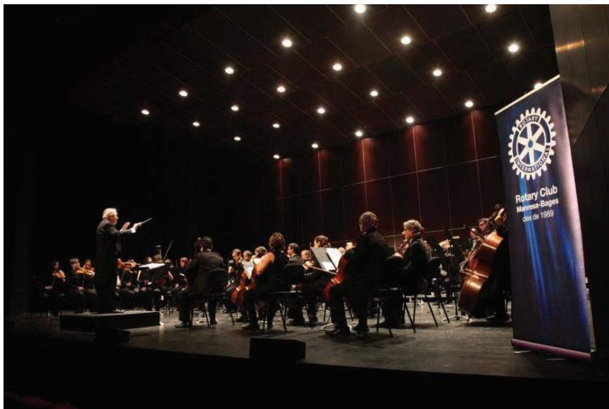
El Concert de Reis del Rotary Club de Manresa-Bages a càrrec de l'Orquestra Simfònica Sant Cugat.

El Rotary Club de Manresa-Bages organitza la 14a edició del Concert de Reis amb l'objectiu d'omplir, la tarda d'aquest proper diumenge 10 de gener, el Teatre Kursaal. I és que tots els diners que es recaptin a través d'aquesta proposta cultural, en les darreres edicions l'import ha estat de 6.000 euros, es destinaran al projecte guanyador de la 14a edició del Premi Simeó Selga. Es tracta del Projecte mentors que guien, estimulen i encoratgen a joves perquè donin el millor d'ells en l'àmbit personal i professional, d'AMPANS.