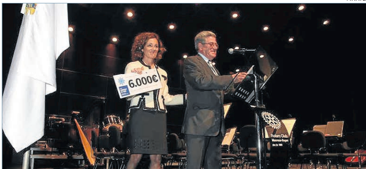
Moment del lliurament del guardó a AMPANS