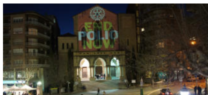
L'acció es portarà a terme entre les 7 de la tarda i les 10 de la nit

La façana de l'església de Crist Rei de Manresa oferirà el dimecres 24 d'octubre una imatge poc usual. El Rotary Club de Manresa-Bages il·luminarà el temple amb les paraules «End Polio Now», una acció que es portarà a terme entre les 7 de la tarda i les 10 del vespre . D'aquesta manera, l'entitat se sumará a la commemoració del Dia internacional contra la poliomielitis , una malaltia infecciosa en clar retrocés però que encara afecta infants d'algunes regions del món.