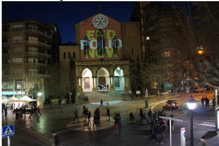
Crist Rei il·luminat pel dia internacional contra la poliomielitis | RCMB

La façana de l'església de Crist Rei de Manresa, un dels punts neuràlgics de la capital del Bages, oferirà el pròxim dimecres 24 d'octubre una imatge poc usual. El Rotary Club de Manresa-Bages il·luminarà el temple amb les paraules End Polio Now , una acció que es portarà a terme entre les 7 de la tarda i les 10 del vespre. D'aquesta manera, l'entitat se sumará a la commemoració del Dia internacional contra la poliomielitis, una malaltia infecciosa en clar retrocés però que encara afecta infants d'algunes regions del món.