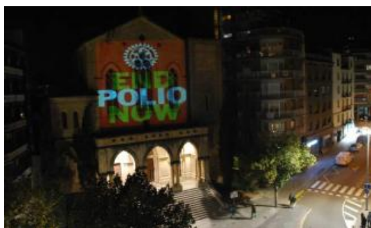
Rotary il·lumina la façana de Crist Rei contra la pòlio catpress

El club Rotary Manresa-Bages ha il·luminat la façana de Crist Rei per commemorar el Dia Internacional contra la Poliomièlitis. Ha volgut recordar, així, que aquesta malaltia infecciosa està en clar retrocés però que encara afecta infants de diverses regions del món. Accions com la de Crist Rei s'han fet arreu del món. El club Rotary fa una campanya per recollir fons per combatre la malaltia.