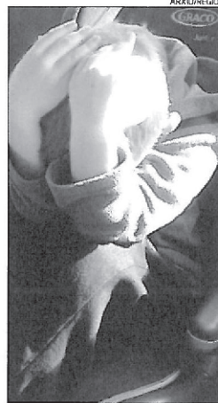
Els afectats tenen dificultats d'interacció social

El premi estarà dotat amb la quantitat resultant dels guanys que generi la celebració del tradicional concert de Reis, que tindrà lloc al teatre Kursaal de Manresa el diumenge 8 de gener a les 7 de la tarda. Serà a càrrec de l'Orquestra Simfònica de Sant Cugat, dirigida per Josep Ferré. Les localitats es poden adquirir per un