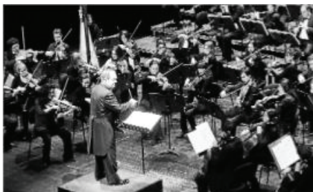
L'orquestra vallesana ja va protagonitzar el concert de l'any passat

Els projectes que vulguin presentar les entitats s'han d'executar al llarg d'aquest any 2012. El premi és obert a entitats i col·lectius de caire civil, cultural, assistencial, esportiu o de qualsevol altre tipus, sempre amb la solidaritat i el servei envers els altres com a lema. Els projectes s'han de presentar a Rotary. Per a més informació, es pot trucar al telèfon 637 80 65 82.