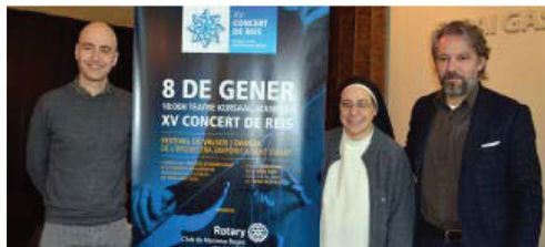
El Concert de Reis del Rotary permetrà avançar en el projecte d' #invulnerables Rotary

El Concert de Reis que anualment organitza el Rotary Club de Manresa-Bages permetrà recaptar fons per al projecte #invulnerablesodontòlegs que, en poc temps ja atén 50 famílies i 120 nens i nenes sense recursos. El treball en xarxa amb les institucions públiques i sanitàries implantades a la comarca fa possible que, a banda de l'atenció bucal bàsica, es formi i sensibilitzi les famílies per aconseguir una bona higiene dental i uns hàbits saludables.