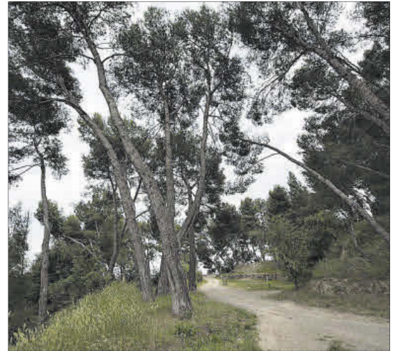
Imatge d'arxiu del parc de Puigterrà

Inspiració 2022 és un grup ampli i divers de persones que volen vetllar pel que pensen que és el nucli fonamental i essencial de Manresa 2022: la commemoració d'una transformació espiritual viscuda per Ignasi de Loiola fa