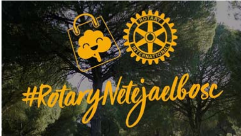
El Rotary Club de Manresa-Bages convida a participar en una jornada de neteja.

És una acció organitzada conjuntament amb el Grup Excursionista Posa't en marxa i l'Ajuntament de Sant Fruitós de Bages.