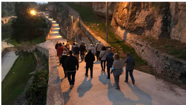
La caminada conscient de Flors Sirera que es va dur a terme el mes d'octubre

La Travessa cap al 2022 prepara una caminada conscient per aquest dimecres fins a la mesquita Al-Fath de Manresa. S'iniciarà a les 7 de la tarda a Plaça Major i acabarà a la mesquita Al-Fath. En aquesta ocasió, els participants seran rebuts pel President de l'Associació Islàmica del Bages – Mesquita Al-Fath i convidats a participar en la pregària del vespre. Per això, en aquest cas, la caminada serà una mica més curta de l'habitual.