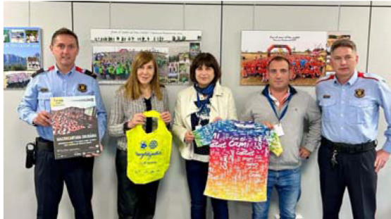
El Rotary Club de Manresa-Bages col·labora amb la caminada solidària 'Fem el camí al teu costat'.

Els participants a la caminada rebran una de les bosses #RotaryNetejaelbosc per recollir brossa.