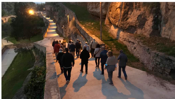
Travessa cap al 2022.

La propera neteja perimetral serà el dissabte 5 de febrer al Turó de Puigterrà.