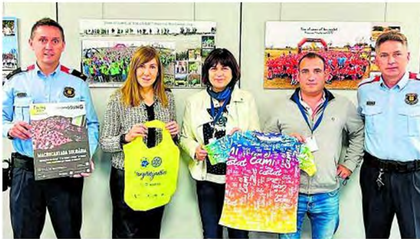
El Rotary Club de Manresa-Bages col·labora amb la caminada solidària «Fem el camí al teu costat» | REGIÓ7

E l Rotary Club de Manresa-Bages ha fet entrega de 1.500 bosses per recollir brossa del bosc a l'organització de la caminada solidària Fem el camí al teu costat. L'entitat col·labora així amb la 10a edició de la caminada solidària, que se celebrarà demà i que té per objectiu recaptar fons per a la lluita contra el càncer. Les bosses es lliuraran als participants a la caminada per tal que les puguin utilitzar en les sortides a la natura que realitzin per recollir els residus que hi puguin trobar. La iniciativa s'emmarca en la campanya #RotaryNetejaelbosc, que l'entitat va posar en marxa a principis d'any per tal de contribuir a netejar l'entorn proper i alhora sensibilitzar de la importància de minimitzar els residus i deixalles que s'acumulen als paratges naturals de la comarca i contribuir a preservar el medi ambient i el territori.