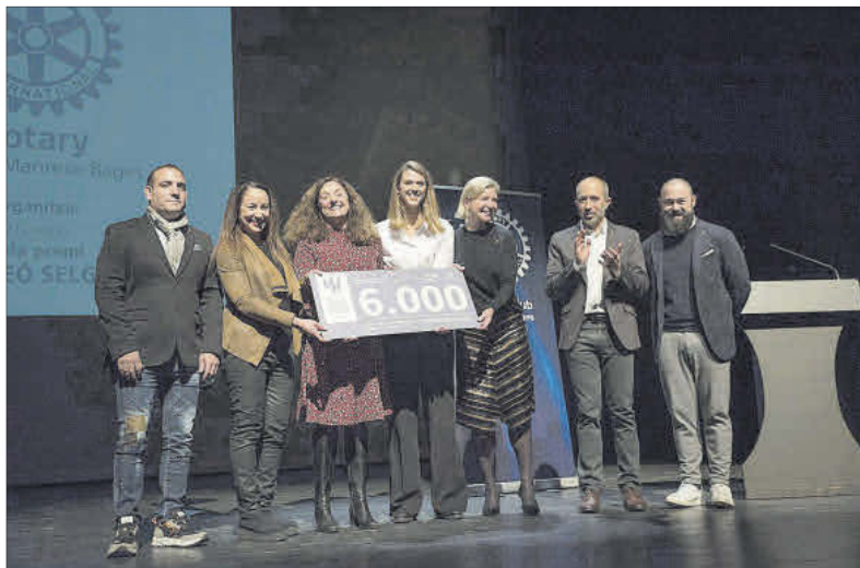
Els guardonats van rebre el Premi Simeó Selga amb satisfacció, en una gala lluïda al Kursaal

L'esdeveniment també va comptar amb la presència i actua-