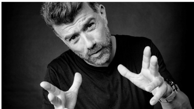
L'actor i humorista Pep Plaza protagonitzarà la Gala Simeó Selga del Rotary Club.

Pep Plaza oferirà l'espectacle 'Ara més' el dia 7 de gener de 2023 a les 7 de la tarda al Teatre Kursaal de Manresa.