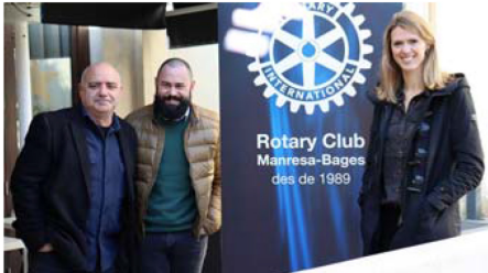
Presentació Gala Simeó Selga.

Pep Plaza oferirà l'espectacle 'Ara més' el dia 7 de gener de 2023 a les 7 de la tarda al Teatre Kursaal de Manresa.