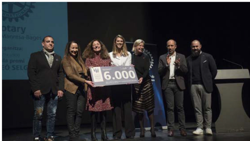
Representants del Club Natació Manresa van rebre el Premi Simeó Selga amb satisfacció, en una gala lluída al teatre Kursaal

Manresa | 08·01·23 | 06:20 | Actualitzat a les 06:20