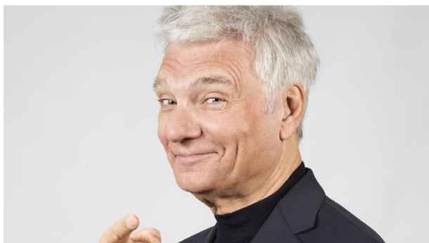
L'actor Carles Sans / FOTOGRAFIA PROMOCIONAL

Carles Sans interpretarà el monòleg teatral Per fi sol en el transcurs de la Gala Simeó Selga, que el Rotary Club de Manresa-Bages organitzarà el proper 7 de gener (19 h) al Teatre Kursaal de Manresa. Les entrades per assistir a la vetllada es poden adquirir al preu de 24 euros a través de la pàgina web de l'equipament, www.kursaal.cat .