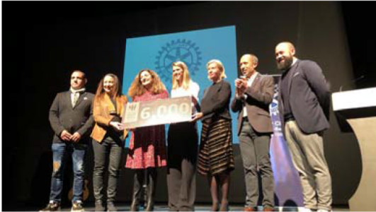
El Rotary Club de Manresa-Bages lliura el 21è Premi Simeó Selga al Club Natació Manresa.

El projecte guardonat s'anomena 'Cap nen/a sense nedar' i té com a objectiu apropar els esports d'aigua a infants en situació de vulnerabilitat.