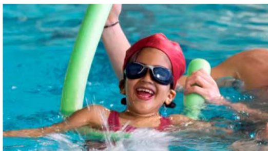
El Club Natació Manresa guanya el 21è Premi Simeó Selga.

El projecte guardonat s'anomena 'Cap nen/a sense nedar' i té com a objectiu apropar els esports d'aigua a infants en situació de vulnerabilitat del centre obert Casal-Ot de Creu Roja Manresa.