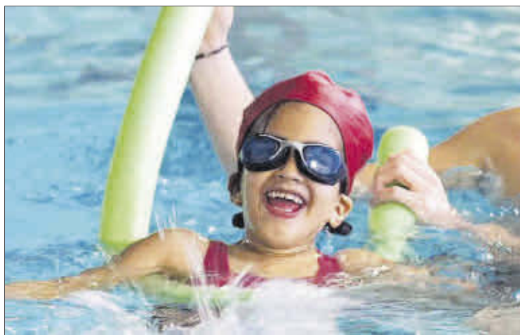
Per als nens vulnerables, l'aigua ha de ser un espai de joc

El projecte guanyador va cristal·litzar com a conseqüència de la suma de l'expertesa en l'ensenyament dels esports d'aigua a nenes i nens del CN Manresa i de l'experiència en l'àmbit assistencial i de protecció de la infància en situació de risc social de Creu Roja Manresa. El programa té el suport de la Fundació Guardiola Sala.