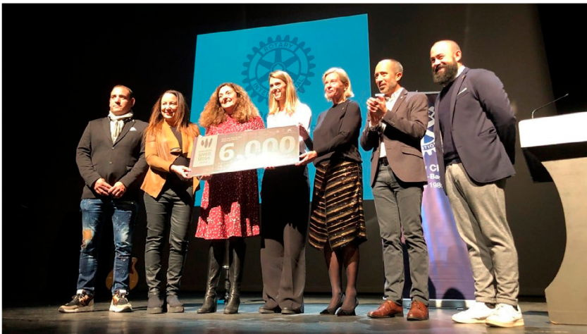
Lliurament del Premi Simeó Selga al CN Manresa | RCMB

El projecte guardonat té com a objectiu apropar els esports d'aigua a infants en situació de vulnerabilitat