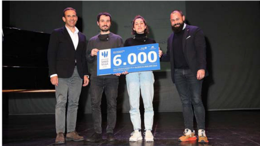
Rotary Club de Manresa-Bages ja té a punt una nova edició del Premi Simeó Selga.

El club convoca una nova edició del certamen, que facilita que el teixit associatiu de la comarca pugui fer realitat un projecte d'interès social.