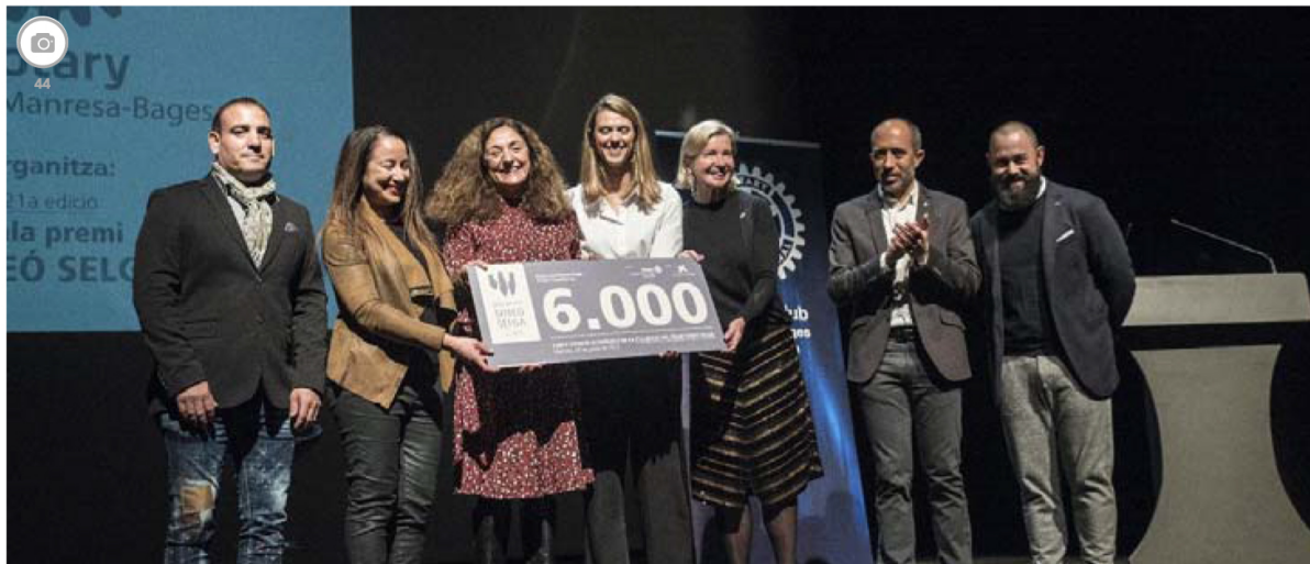
Totes les imatges de la 21a gala del premi Dr. Simeó Selga

La 21a edició del guardó ha premiat un projecte que pretén apropar els esports d'aigua als infants amb vulnerabilitat i risc social. La distinció es va lliurar en una gala al teatre Kursaal de Manresa, que va incloure un espectacle de l'humorista Pep Plaza.