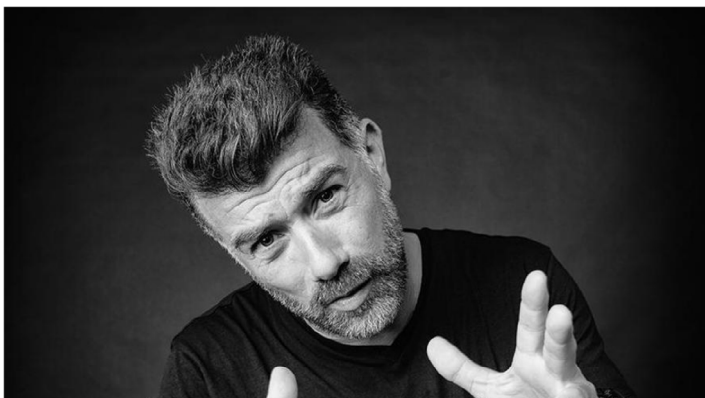
L'actor i humorista Pep Plaza

Manresa | 05-12-22 | 12:14 | Actualitzat a les 12:54