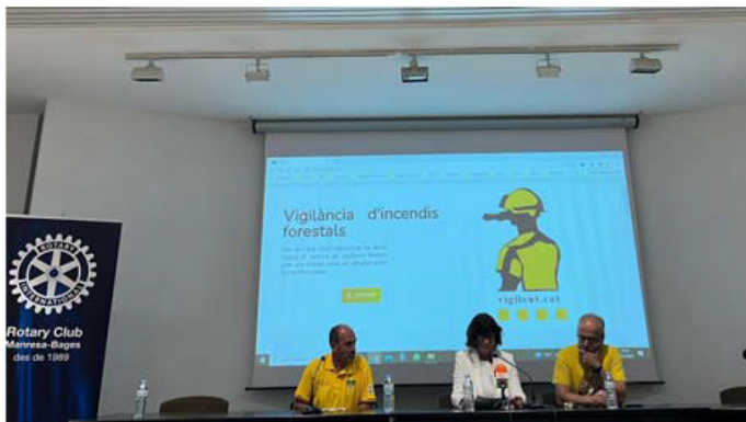
Presentació de les noves càmeres de videovigilància forestal

Representants dels Mossos d'Esquadra de la Regió Policial Central, del cos de Bombers de la Generalitat de Catalunya, dels Agents Rurals i de les Agrupacions de Defensa Forestal (ADF) del Bages i el Moianès van assistir aquest dimecres a la presentació de les noves càmeres de videovigilància forestal que ha finançat el Rotary Club de Manresa-Bages . L'acte va tenir lloc a la seu de la Federació de les ADF del Bages i el Moianès, situada al Palau Firal de Manresa, que és des d'on es visualitzen les imatges.