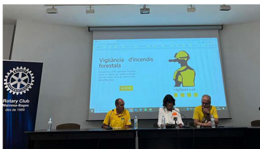
Presentació de les càmeres de vigilància forestal aquest dissabte al Palau Firal de Manresa | RCMB

Les càmeres, que estan operatives des de l'estiu passat, estan ubicades a Castellnou de Bages i a Súria