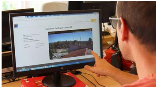
Instal·lació de tres càmeres de vigilància forestal.

Les noves càmeres, que ja estan operatives, s'han instal·lat a Castellnou de Bages i a Súria.