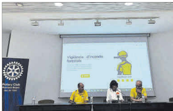
Presentació al Palau Firal de les noves càmeres

Aquests tres punts d'observació permeten cobrir una superfície de 700 quilòmetres quadrats del sector nord-oest de la comarca del Bages. L'objectiu és poder detectar qualsevol indici de fum o foc el més ràpid possible per, així, poder actuar amb la màxima celeritat i evitar l'expansió de les flames. La tria d'aquests punts va anar a càrrec de representants de les ADF del Bages